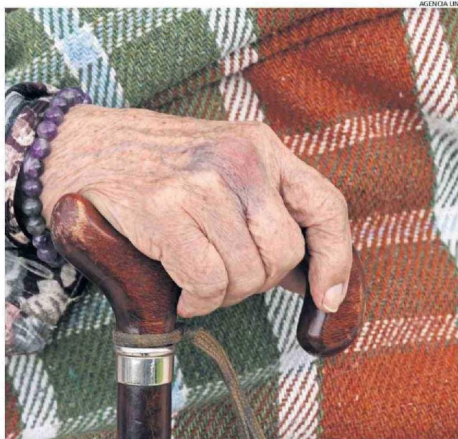
UN FACTOR CRÍTICO ES LA SALUD DENTAL Y VISUAL DE ADULTOS MAYORES: MUCHOS NO PUEDEN LEER ETIQUETAS.

mentaria se refiere a "la disponibilidad limitada o incierta de alimentos por factores sociodemográficos, ingreso económico, conocimientos y habilidades nutricionales, cercanía con lugares de abastecimiento, red de apoyo y otros".