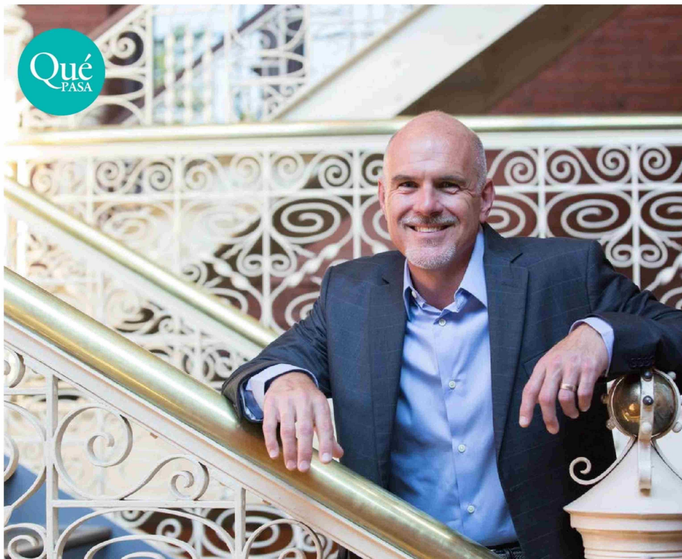
► El neurocientífico estadounidense Michael Platt se dedica a investigar los procesos de toma de decisiones del cerebro.