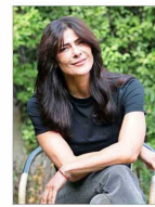
La animadora dio su testimonio como imputada.

"LO EMPUJARON", "BRUTALIDAD POLICIAL": LOS MENSAJES DEL PRESIDENTE BORIC Y FIGURAS DEL FA-PC TRAS LA CAÍDA DEL JOVEN AL RÍO MAPOCHO DURANTE UNA PROTESTA EN EL MARCO DEL ESTALLIDO | C1 y C2