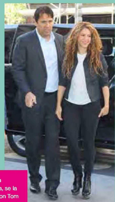
Recién separada, se la asoció con Tom Cruise. Abajo, la cantante con su hermano Tonino.