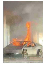
Conductor era un militar activo y se disparó en la cabeza.

La proveniente de combustibles fósiles continúa a la baja y el carbón solo representa el 15% del total generado en 2024, aunque los hidrocarburos se mantienen aún presentes en la vida cotidiana, debido a su masivo uso en el transporte o la calefacción. | B 1