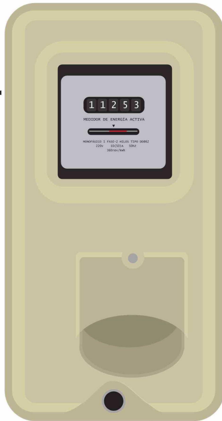
ILUSTRACIÓN: ANDRÉS OREÑA P.