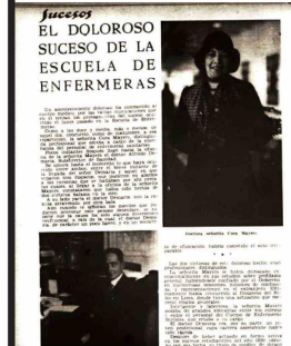
Revista Sucesos, enero 1931.