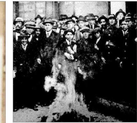
Asalto de la Federación de Estudiantes de la Universidad de Chile (FECh), 1920.