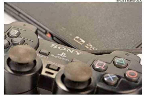
160 MILLONES DE UNIDADES SE HAN VENDIDO DESDE EL 2000.