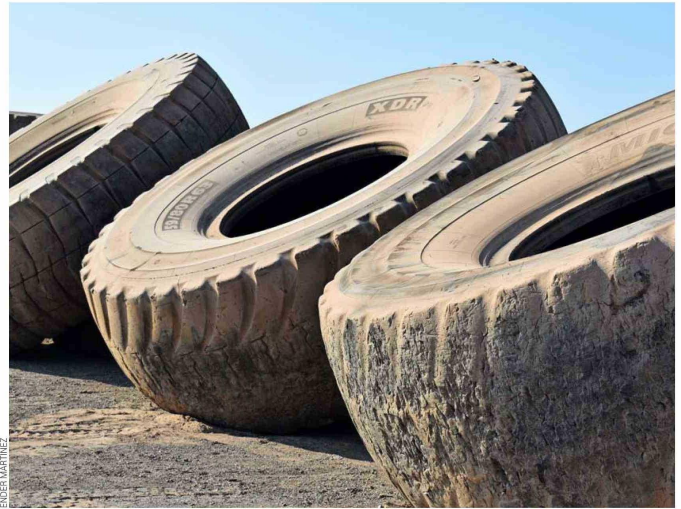
Acopio de neumáticos gigantes fuera de uso.

“En Exponor conversé con faenas y contratistas mineros que me comentaron que los sistemas de gestión no les están retirando sus neumáticos de manera eficiente. Las diferencias de precio entre