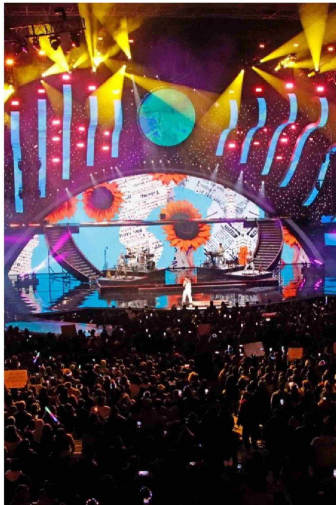
► La organización del Festival de Viña no se ha referido sobre las críticas del tema.