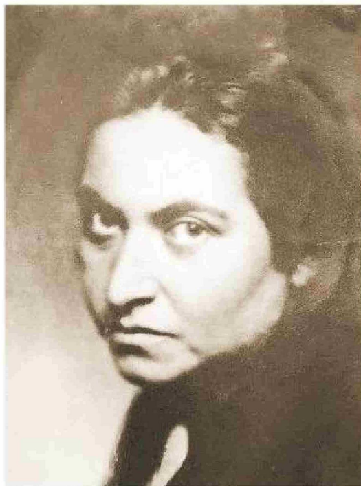
Foto inédita de Gabriela Mistral encontrada una por alumna.

Intercambio con el colegio Antonio Varas de Vieña.