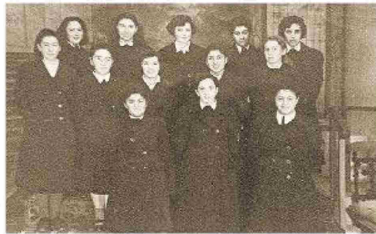
Sexto Año de Humanidades 1955.

Fundado el año 1906, el Liceo Sara Braun de Punta Arenas fue el primer liceo público de educación secundaria femenina de la Región de Magallanes. Cuando abrió sus puertas a la comunidad magallánica contó con dos cursos de preparatorias y dos