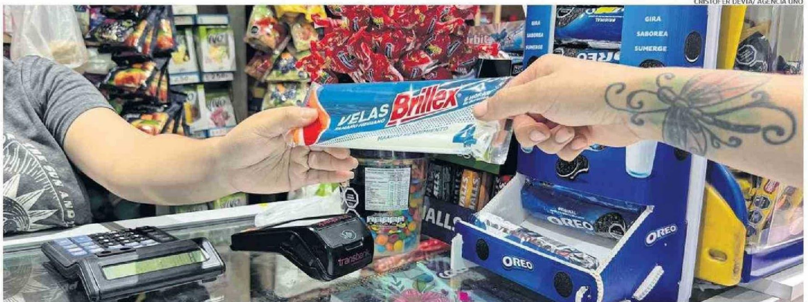
EL CORTE DE LUZ AFECTÓ A 14 REGIONES DEL PAÍS. EN LA REGIÓN FUERON MÁS DE 160 MIL CLIENTES QUE SE VIERON PERJUDICADOS POR EL CORTE DE SUMINISTRO.

“La gente la verdad hizo caso y lograron de manera tranquila retirarse a sus domicilios. Tuvimos más de 4.180 salvoconductos”, dijo el general. Además, acotó que “tuvimos a través de los más de 600 controles de aire vehiculares, cuatro detenidos. De esos, uno por desacato, otro por ley de pesca y dos por órdenes vigentes. Solamente hubo uno que cometió la infracción por el toque de queda”.