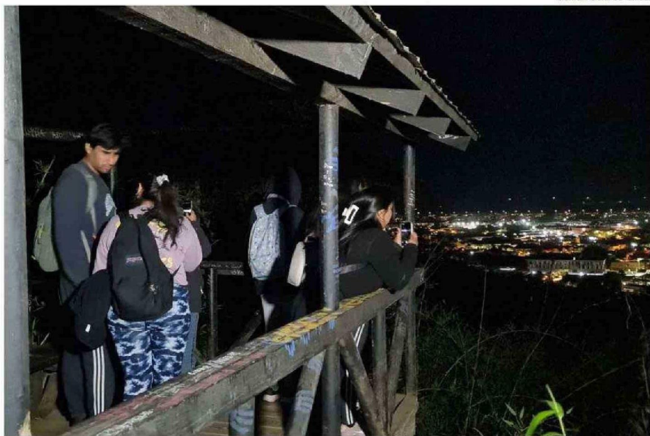
DESDE EL MIRADOR SE PUDO APRECIAR LA INFLUENCIA DE LA CONTAMINACIÓN LUMÍNICA EN EL CERRO NIELOL.

Con este tipo de iniciativas, la Municipalidad de Temuco busca fortalecer el vínculo de la ciudadanía con su entorno natural y fomentar prácticas sostenibles que contribuyan a la preservación del patrimonio ambiental local.