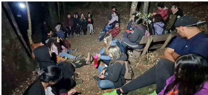
EL CONTACTO CON LA NATURALEZA PERMITIÓ CONOCER CÓMO ES LA VIDA DURANTE LA NOCHE, AL INTERIOR DEL MONUMENTO NATURAL CERRO NIELOL.