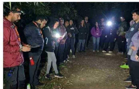
VEINTE PERSONAS PARTICIPARON DE ESTA EDUCAMINATA.