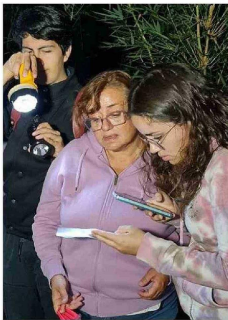
LOS PARTICIPANTES DISFRUTARON DE LA NATURALEZA DE FORMA SENSORIAL.