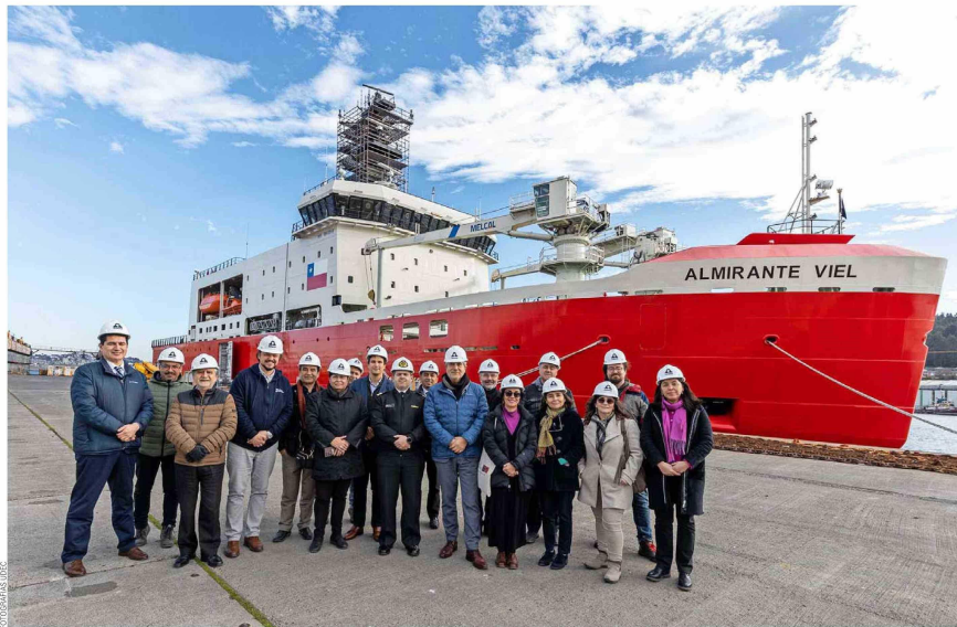
Autoridades e investigadores UdeC frente a rompehielos en la Base Naval de Talcahuano.

"Este buque fue diseñado para potenciar la capacidad científica, principalmente en el área antártica, y representa una alianza fundamental entre la Armada y las instituciones de investigación. La