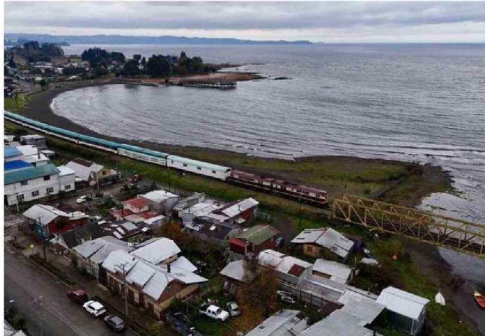
UNO DE LOS VIAJES DEMOSTRATIVOS DURANTE EL DÍA DE LOS PATRIMONIOS, EN MAYO.

Asimismo, se está determinando a los operadores que van a ofrecer ese servicio intermodal “para recibir toda la descarga de pasajeros que haga cada tren que llega a la estación”. Estimó que esperan una tasa de ocupación de un 80% de cada tren o unos 170 pasajeros, para lo que se requerirá de cinco o seis micros en cada llegada. En la tarifa del boleto del viaje en tren, estará incluido el