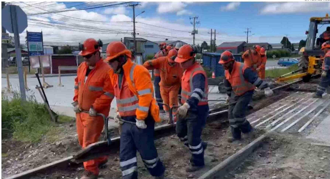
DURANTE LOS ÚLTIMOS DÍAS, LOS TRABAJOS DE EFE HAN ESTADO LOCALIZADOS EN LOS CRUCES FERROVIARIOS, COMO EL DE LA VARA.

viaje entre Llanquihue y Puerto Montt, según EFE; entre Puerto Varas y Puerto Montt se calcula en 27 minutos.