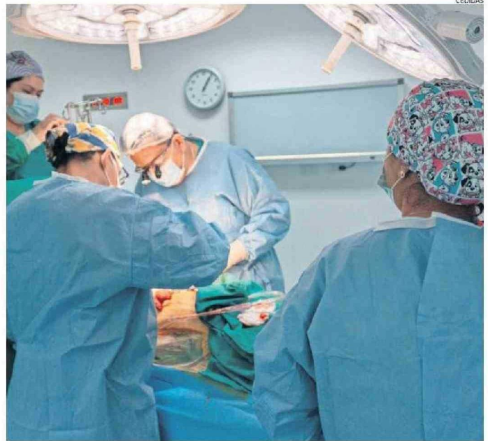
LA UNIDAD ESPECIALIZADA DEL HRA HA REALIZADO DOS MIL CIRUGÍAS DESDE SU CREACIÓN EN EL 2012.

lizaron las primeras cirugías cardiovasculares en 2012, el centro de salud ha experimentado un crecimiento constante en esta área. En sus primeros años, las intervencio-