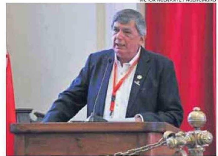
EL LÍDER DEL PC, LAUTARO CARMONA, EN EL SEGUNDO DÍA DE REUNIÓN.