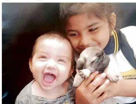
LA SONRISA INEFABLE DEL ANGELITO QUE PARTIÓ MUY PRONTO

La pequeña falleció tras contagiarse el virus sincicial y sus seres queridos creen que una atención especializada oportuna pudo haberla salvado.