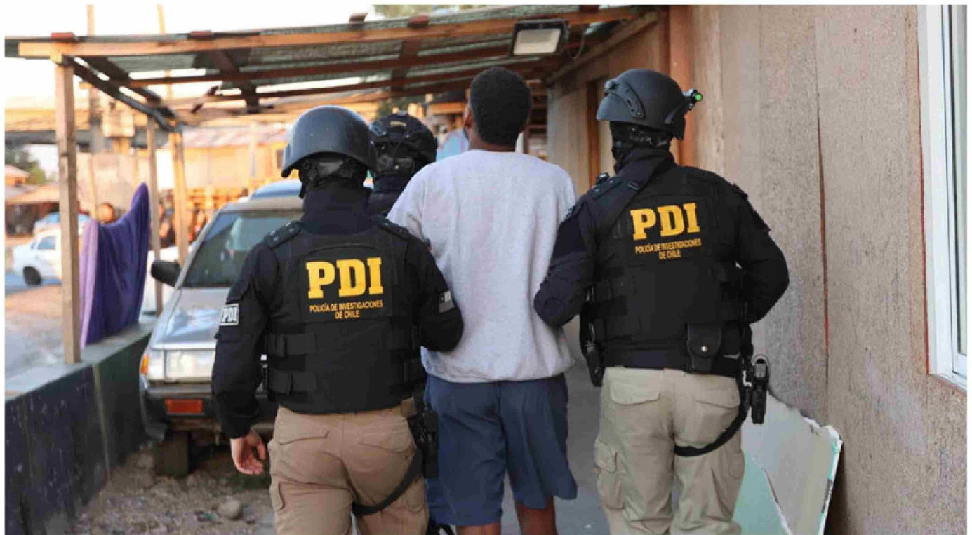
► Hasta ahora no se ha entregado detalle pormenorizado del número total de personas que serán encausadas.

Asimismo, se registran mensajes de WhatsApp que enviaban entre ellos: “Ese H... no quiere pagar ya lo voy a volver a atacar”. ●