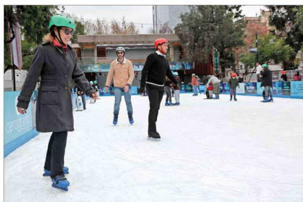
PROVIDENCIA. — Ayer cientos de personas llegaron a disfrutar de la pista de patinaje sobre hielo en el Parque Bustamante.

Es decir, nada parecido a las de la semana pasada.