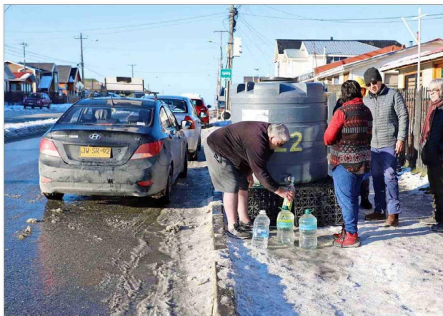
PUNTA ARENAS. —22 mil hogares sin agua potable fue uno de los efectos de las bajas temperaturas en Magallanes. El principal problema en la ciudad fue la rotura de medidores por el congelamiento del agua.

Moncada aclaró que "el nuevo sistema frontal afectará con precipitaciones desde la Región del Biobío hacia el sur del país. A finales del miércoles estarían registrándose las primeras precipitaciones en Concepción y Los Ángeles", pero puntualizó que estas nuevas lluvias "de momento estarían dentro de los rangos normales para la época".