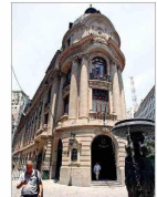
Empresa busca comprar el emblemático edificio de la Bolsa de Comercio de Santiago. | B 4

Escándalo por criptomoneda envuelve a Milei: mandatario promociona divisa virtual que sube su valor, luego se desploma y vinculan a estafa | A 5