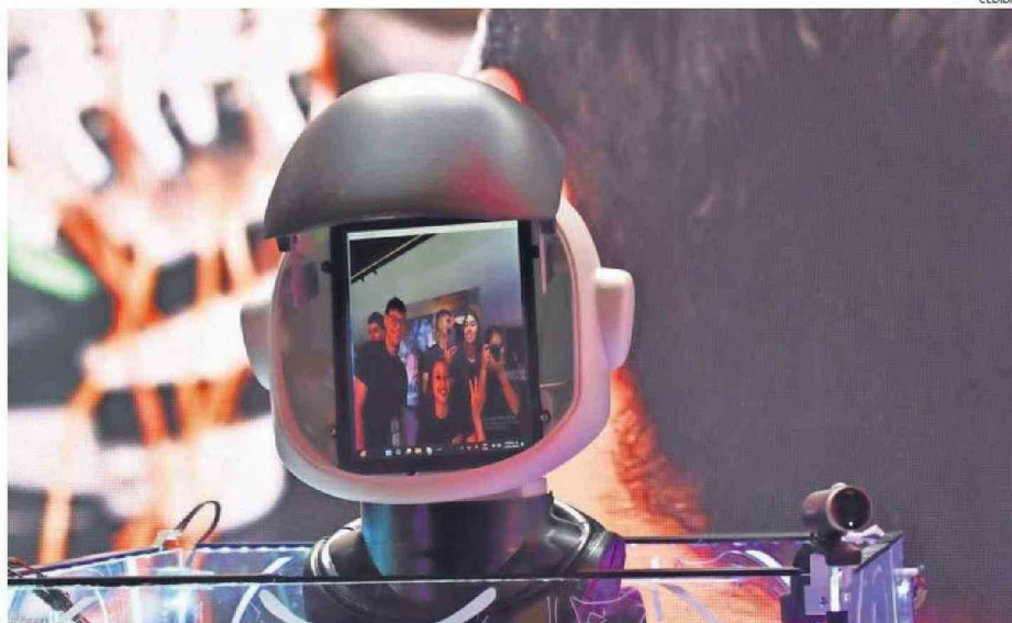
LA CABEZA DE STELARBOT YA ESTÁ LISTA Y SE EXHIBIÓ EN CONGRESO FUTURO 2025. EN EL CASCO SE VERÁ EL ROSTRO DEL USUARIO.