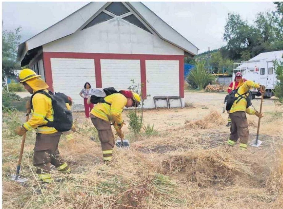
En la Provincia del Biobío brigadistas refuerzan la limpieza de cortafuegos y zonas de interfaz como medida preventiva ante incendios.

TRABAJO CON MUNICIPIOS El director de Conaf detalló