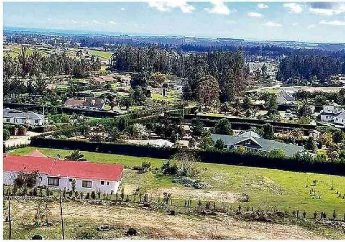
LA LOCALIDAD DE LEYDA EN LA COMUNA DE SAN ANTONIO.

Las obras a ejecutar contemplan retiro de asbesto de cemento, cambio de cubierta, ampliación del hall del acceso, para habilitar un comedor y un