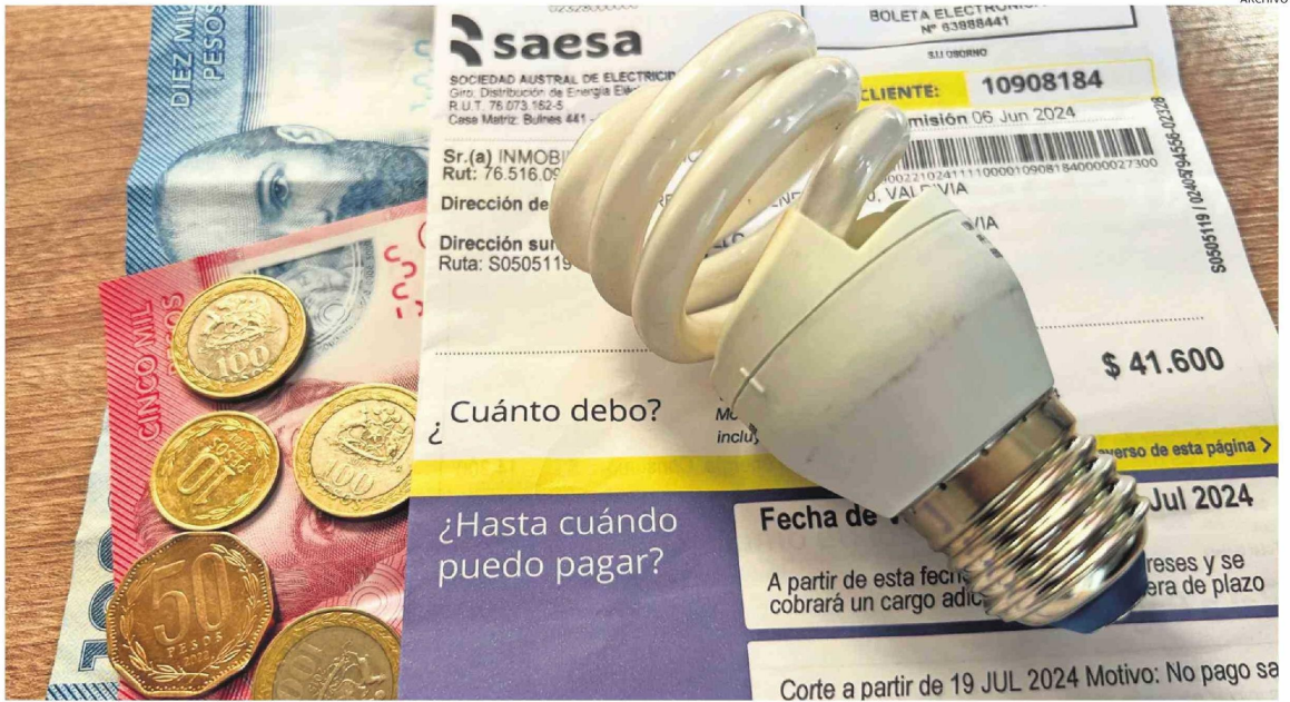
SUBSIDIO ELÉCTRICO FAVORECERÁ AL 40 POR CIENTO MÁS VULNERABLE DE LA POBLACIÓN DE ACUERDO CON EL REGISTRO SOCIAL DE HOGARES.

Y en particular el diputado Ilabaca le hizo presente el proyecto de ley que presentó en conjunto con la bancada del Partido Socialista, el cual busca -explicó- "que se elimine como