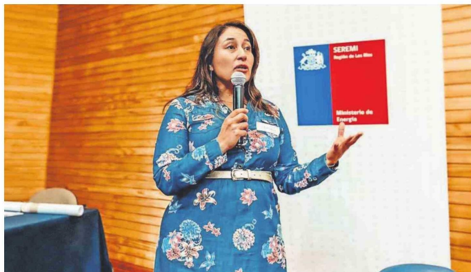
LA SEREMI DE ENERGÍA EXPLICÓ LOS ALCANCES DEL INCREMENTO Y DEL SUBSIDIO.

requisito para postular al subsidio que va a beneficiar a un millón y medio de personas, de familias, el requisito de tener las cuentas de luz al día. Porque actualmente de ese millón y medio hay 600 familias que están endeudadas y que es una ilusión el poder postular a este beneficio que otorga el Estado".