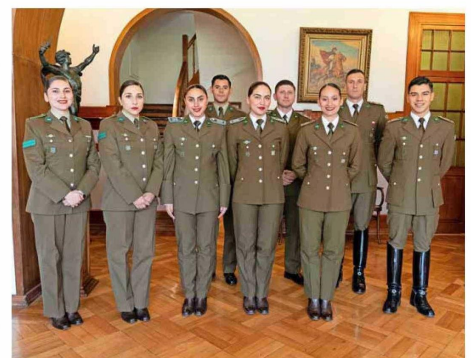
El acuerdo entrega a Carabineros descuentos en la matrícula y en el arancel, además de posibilidades de becas y aplica para todas las carreras impartidas por Duoc UC, en cualquiera de sus sedes y modalidades.