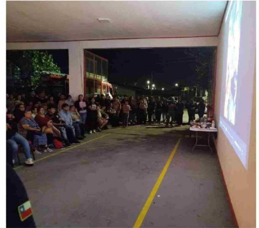
COMPAÑEROS, FAMILIARES y vecinos lamentan la pérdida del joven yumbelino.