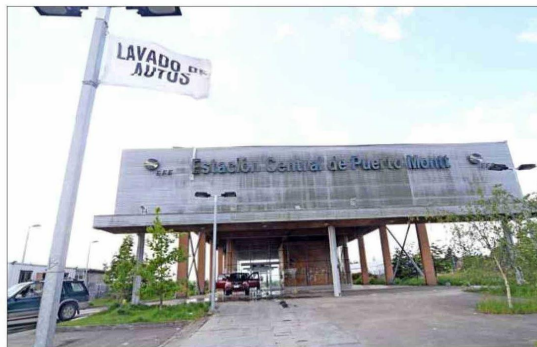
OBRA. — La estación La Paloma fue construida en 2005. Al fracasar el proyecto del tren, se le ha dado diversos usos, como un lugar para lavar autos.

han realizado otros anuncios para “revivir” el tren en el sur, tras la frustrada experiencia de 2005, cuando incluso a la inauguración del servicio que restablecía la operación entre Victoria y Puerto Montt llegó en el