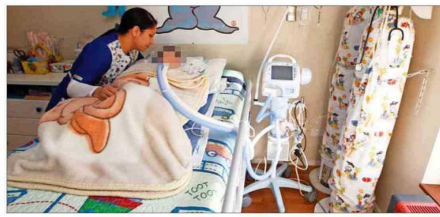
REGISTRO.— En Chile hay, a la fecha, casi diez mil pacientes electrodependientes registrados en la Superintendencia de Electricidad y Combustibles que requieren de diferentes máquinas para vivir.

luz, y la principal crítica que se repite es que hubo demora en la entrega de generadores de emergencia a los pacientes.