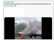
Dependencias del Ejército en Colina no fueron "atacadas" el jueves.

Asimismo, se compartieron supuestas denuncias contra partidos políticos ("el PC está pagando por incendiar Valparaíso") y discursos de odio contra migrantes, especialmente venezolanos.