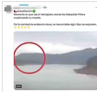
La imagen muestra un accidente aéreo en Brasil, en enero de este año.

Y en el caso de la muerte del expresidente Piñera, circularon por lo menos cinco videos de vuelos en helicóptero que no correspondían al accidente y un falso registro de las labores de rescate.