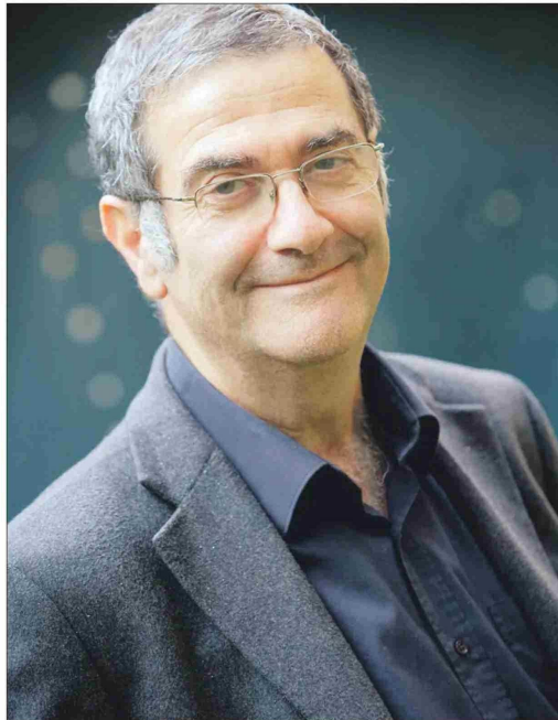
El francés Serge Haroche, premio Nobel de Física 2012 expondrá el miércoles 15 a las 15 horas.