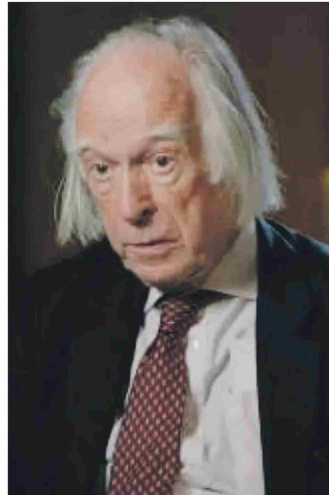
El fisiólogo británico Denis Noble expondrá el lunes 13 a las 12:15 horas.