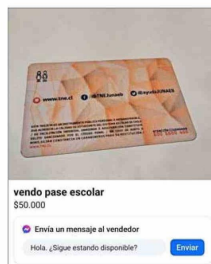
La TNE es comercializada a través de internet, al igual que sus sellos.