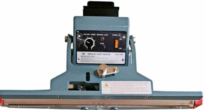
Selladora de pedestal.

En el corazón del negocio están también las máquinas selladoras, con una amplia variedad de modelos para distintas necesidades. Desde equipos portátiles y de sobremesa, como las selladoras