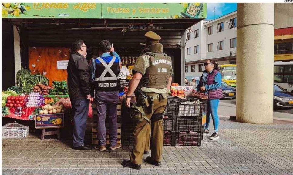
AYER COMENZÓ UNA FUERTE FISCALIZACIÓN DE AUTORIDADES Y CARABINEROS A LA VENTA AMBULANTE.