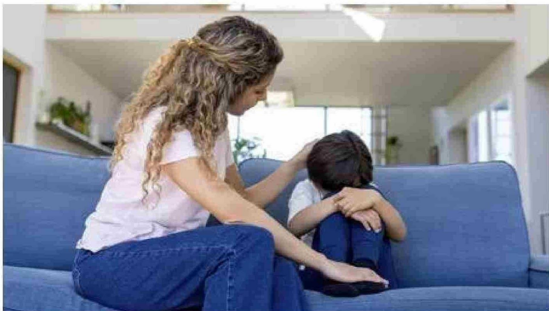
Los padres, educadores y profesionales de la salud mental pueden ayudar a los jóvenes a utilizar las redes sociales de manera segura y saludable, y a desarrollar estrategias para manejar los posibles efectos negativos en su salud mental.

ciales y el tiempo frente a las pantallas aumentaban el riesgo de trastornos alimentarios, y que el uso problemático aumentaba