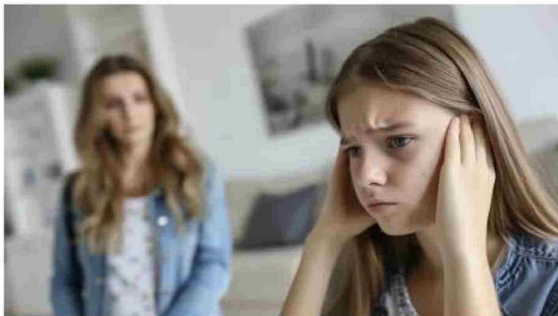
Padres pueden ayudar creando planes de uso de medios y hablando sobre el uso problemático de pantallas.

Los resultados mostraron que el uso promedio de las redes so-