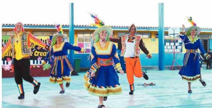
LA ALEGRÍA FUE TOTAL EN EL ESTABLECIMIENTO.