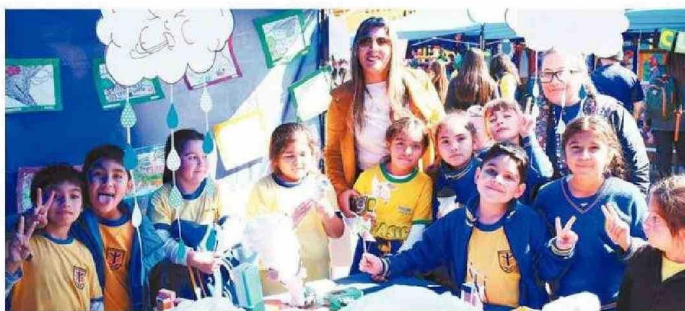
DESTACARON LA IMPORTANCIA DE TENER ESTAS ACTIVIDADES PARA LA COMUNIDAD ESCOLAR.