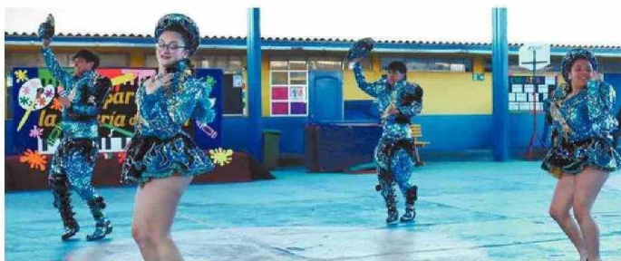
BAILLES LOCALES FUERON PARTE DE ESTA SEMANA.