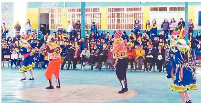
DELEITARON CON SUS BAILLES.