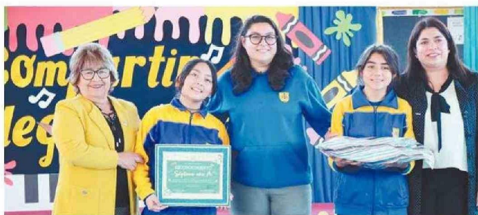
SE RECONOCIÓ A LAS MEJORES ASISTENCIAS A CLASES.