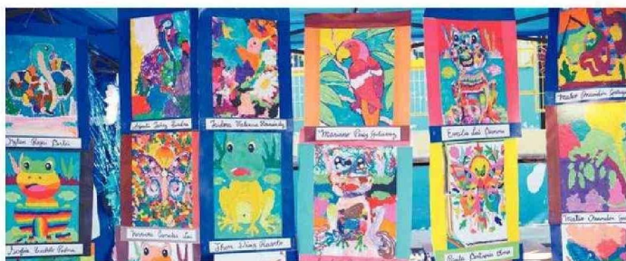
MOSTRARON VARIADAS EXPRESIONES ARTÍSTICAS ANTE AUTORIDADES Y APODERADOS.