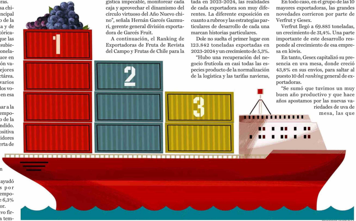
FRANCISCO JAVIER OLEA

“Se sumó que tuvimos un muy buen año productivo y que hace años apostamos por las nuevas variedades de uva de mesa, las que