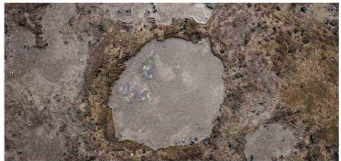
EL RESGUARDO ANTE LAS AMENAZAS EXISTENTES PREOCUPA A AUTORIDADES Y CIENTÍFICOS.