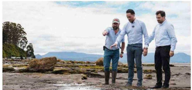
EL ALCALDE ANUNCIÓ PROYECTO DE RESGUARDO PARA ESTOS SITIOS.