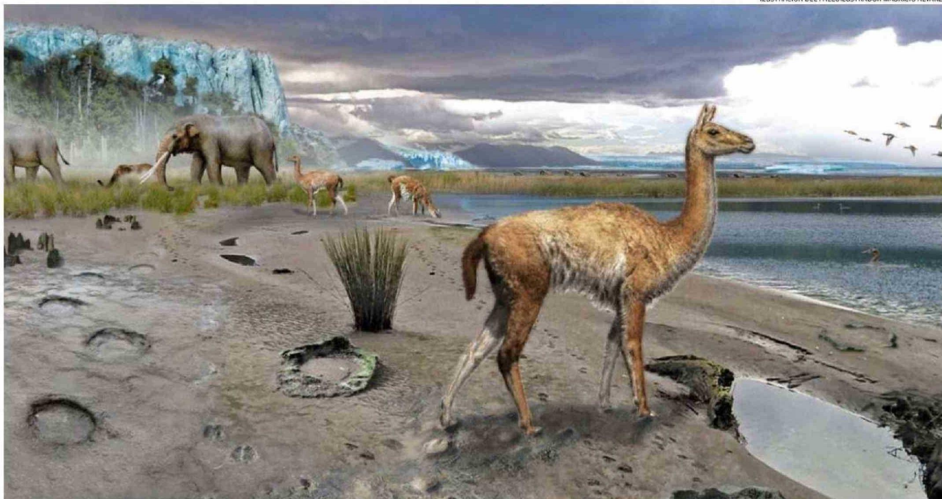
ESTA ILUSTRACIÓN RETRATA EL LUGAR Y LA FAUNA DE PUERTO MONTT.

ILUSTRACIÓN DEL PALEOILUSTRADOR MAURICIO ÁLVAREZ