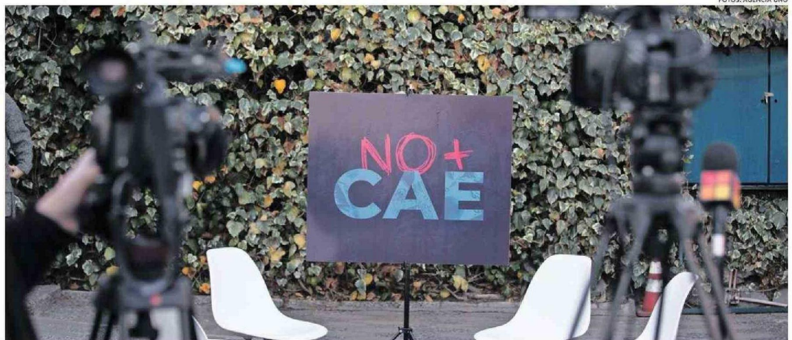
PARA SEPTIEMBRE EL GOBIERNO COMPROMETIÓ LA ENTREGA DEL PROYECTO PARA LA CONDONACIÓN DEL CAE.

"Recordemos que el Estado es el aval, el que presta el dinero es la banca. De acabarse el CAE, se le debe pagar a las Instituciones financieras el to-