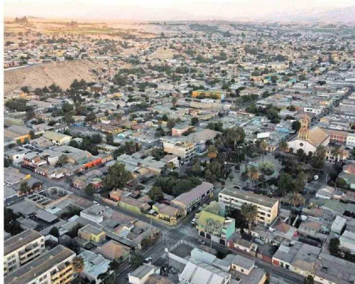
EN LA REGIÓN DE ATACAMA SE REGISTRABAN 1.736 PERSONAS MOROSAS EN BASE A DATOS DEL 2017.

ro mi carrera costó $5 millones y fracción, y con las 240 cuotas de $60 mil, terminaré pagando como $14 millones, me parece muy injusto".