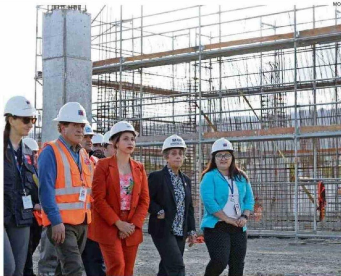
"IREMOS PASO A PASO", DIJO LA MINISTRA SOBRE EL HOSPITAL DE LA UNIÓN. LO MISMO SOBRE EL MAC-UACH.

-En este minuto sí están asegurados. Son recursos también del FNDR (Fondo Nacional de Desarrollo Regional) y sí, porque el proceso de asignación fue hace poco, entonces el presupuesto está actualizado y la propuesta también, es nueva, entonces debería incorporar