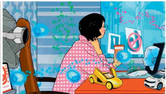
THE WALL STREET JOURNAL. Los adelantos tecnológicos que marcarán el 2025