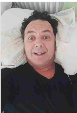
Está un poco aburrido en la cama, pero aprovecha de leer y preparar material.

Desde España cuenta que el dolor que sintió fue "heavy", que tuvo que suspender un viaje a Chile y que no sabe si tendrá secuelas. Traumatólogo habla del escenario que enfrenta.