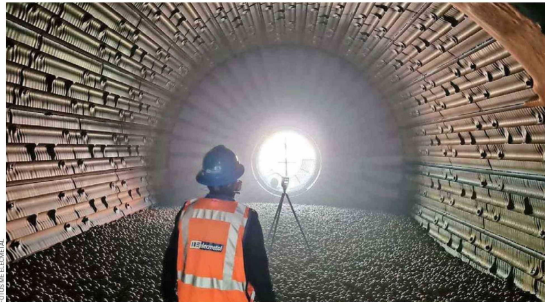
Entre la oferta de productos y servicios que ME Elecmetal posee destacan las bolas de acero para la molienda.

En la búsqueda por entregar siempre las mejores soluciones a sus clientes, la empresa incluye dentro de sus servicios integrales de chancado el suministro de repuestos para equipos de trituración, ofreciendo una amplia gama para trituradoras de cono, giratorias y mandíbulas. Esto posibilita a sus clientes acceder a repuestos de alta calidad para todas las máquinas de trituración del mercado de minería, desarrollados con ingeniería propia y diseñados bajo los estándares y certificaciones exigidas por los fabricantes de equipos,