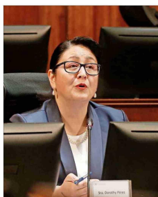
Sala vota el lunes la nominación de la hoy contralora (s), quien se mostró emocionada al dar cuenta de sus dos décadas en la institución.

➤ Pese a que hasta ahora no existen cautelares sobre el imputado, la PDI debe dar aviso inmediato a la fiscalía si la dimitida autoridad se presenta en un terminal aéreo o un complejo limítrofe. | C 13