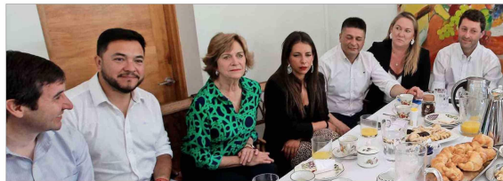
La alcaldesa Evelyn Matthei planea formar un grupo que asesora a ediles y gobernadores electos de Chile Varios. Aunque la idea todavía está en gestación, la jefa comunal explica que están dedicados a que las futuras autoridades puedan hacer "un gran trabajo desde el minuto uno".

➤ Sostiene que si el establecimiento, "teniendo capacidad para 2.500 jóvenes, hoy no tiene ni un tercio, es precisamente porque están amedrentados los profesores, los auxiliares, las demás familias".