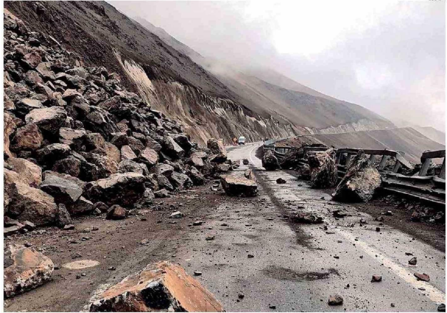
LAS OBRAS DE REPARACIÓN DE LAS AFECTACIONES A LA RUTA 5 NORTE PODRÍAN EXTENDERSE POR 12 MESES.