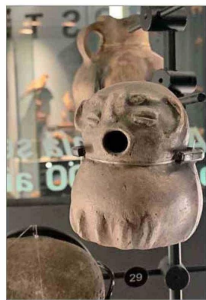
Figura antropomorfa de la cultura Pitrén que se puede ver en el Museo de Historia Natural de Concepción.