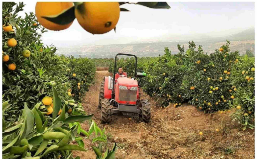
LAS TECNOLOGÍAS DISPONIBLES en la actualidad permiten a los agricultores adaptarse mejor a las condiciones traídas por el cambio climático.

En relación al apoyo de la tecnología a la hora de llevar en el