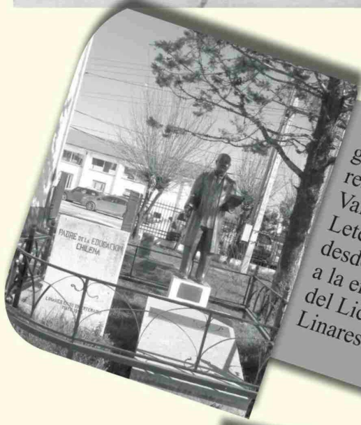
Tumba que guarda los restos de Valentín Letelier desde 1994, a la entrada del Liceo de Linares.