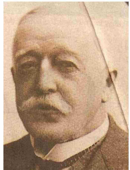
Muchas leyendas, mitos y hazañas heroicas de Slight y su equipo llenan las historias maríneas.

aquel hombre que superó lo imposible, arrastrando lo que no se podía cargar e iluminando al navegante en las complejas rutas marítimas que forjan nuestra historia.