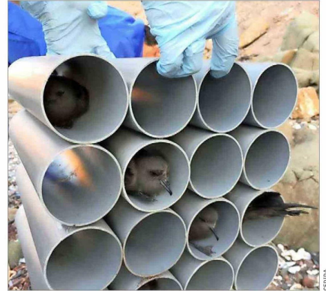
INTERÉS.— Sus hábitos y rutas han sido estudiados en los últimos años.

Todo lo anterior ha activado masivas campañas para salvar a la mayor cantidad posible de aves. “Hemos logrado rescatar a más de tres mil ejemplares en un solo año”, informa el departamento de Gestión Ambiental de la Municipalidad de Arica.